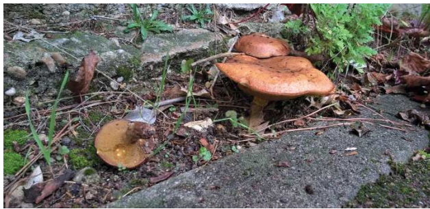
Sur le trottoir de l'avenue de Touraine