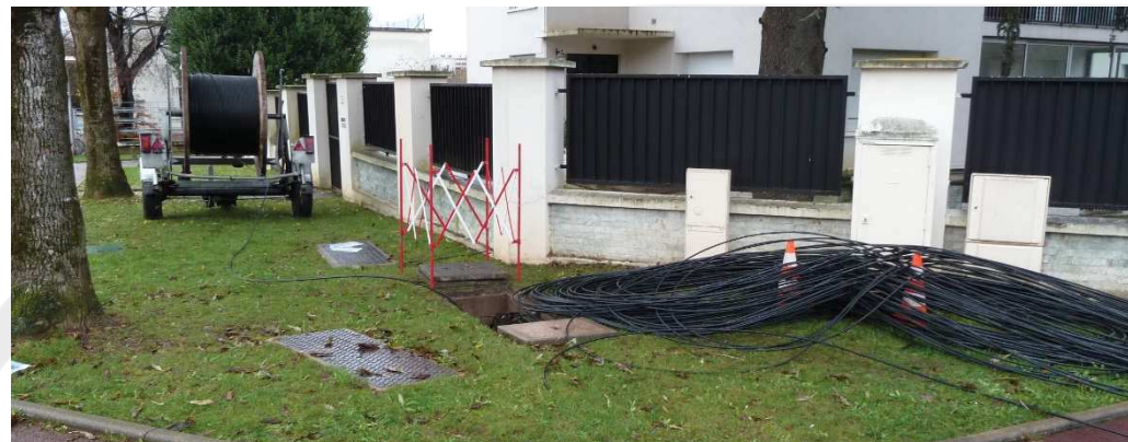
Équipements installés en 2014 et toujours pas en service : pose de câbles le 8 décembre 2014 et armoire (point de mutualisation)

La dernière rencontre avec Numéricable-SFR (aujourd'hui Altice) remonte au 17 novembre 2015, lors d'une réunion organisée par la mairie de Sceaux et concernant toute la ville. À cette occasion, cette société avait fait valoir que la montée