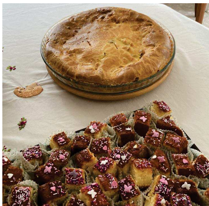
Un buffet de spécialités aveyronnaises, et de gâteaux tous plus appétissants les uns que les autres !